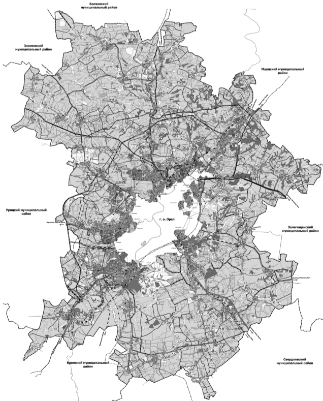
Карта объектов производственной, инженерной и транспортной инфраструктуры