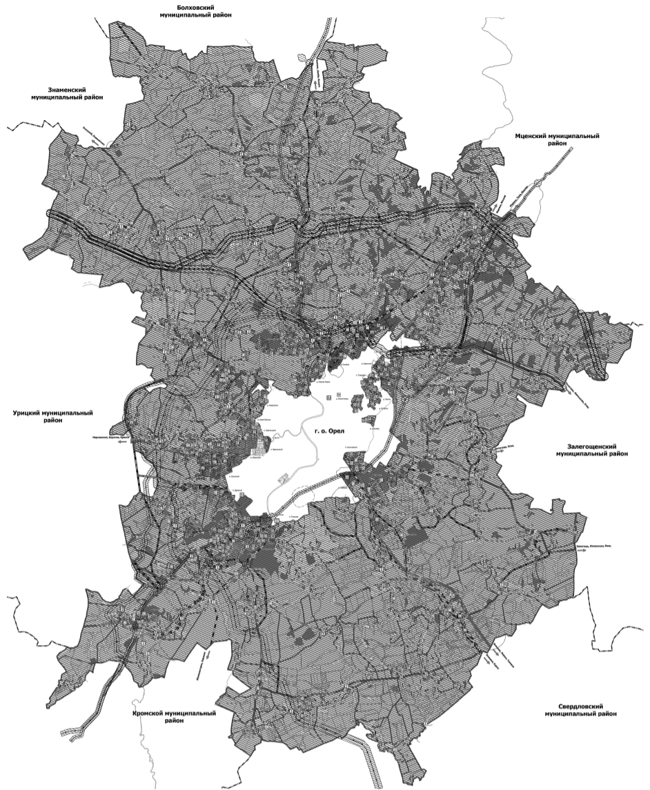
Карта территорий, подверженных риску возникновения чрезвычайных ситуаций природного и техногенного характера